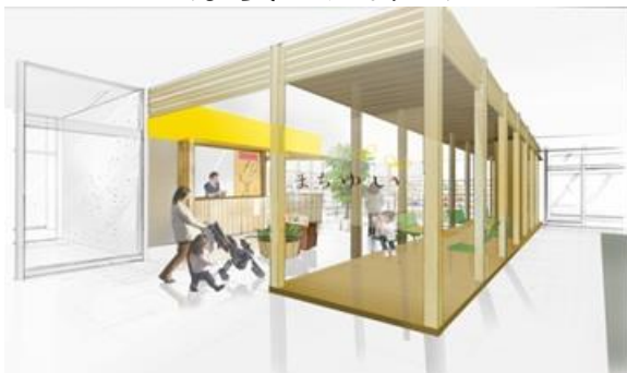
<まちゆいショップ>