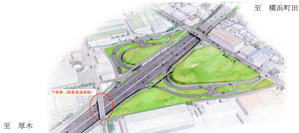
綾瀬スマートインターチェンジ完成予想図

跨高速道路橋撤去 ① しもはら 下原橋 撤去延長：約 33m 撤去重量：約 360t