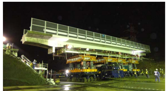
撤去工事のイメージ