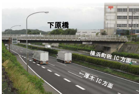
跨高速道路橋現況写真