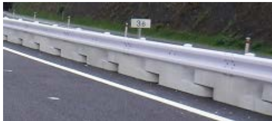
(置き式ガードレール設置状況例)

工事一車線規制への車両突入を防ぐため、規制箇所に堅固な置き式ガードレールを設置します。 (模式図参照)