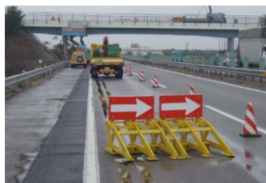
(物理的防御装置設置状況)

工事規制内への誤進入対策として、工事箇所手前に物理的防御装置および標識車を設置し、誤進入した車両と作業従事者との接触を防止します。(模式図参照)