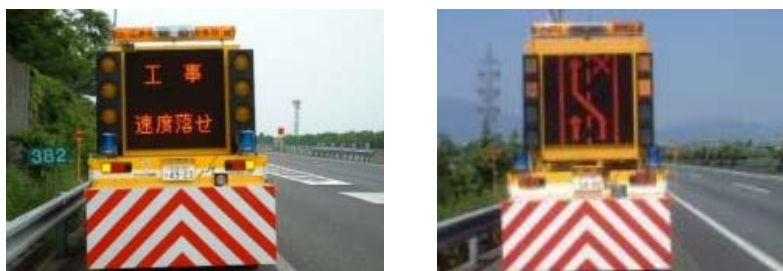
(渋滞末尾警戒車の配置)

渋滞末尾での追突事故を防ぐため、適切なポイントとタイミングで注意喚起をおこなうために、渋滞末尾付近の路肩に標識車を配置させていただきます。