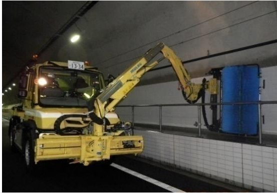
《トンネル側壁清掃》