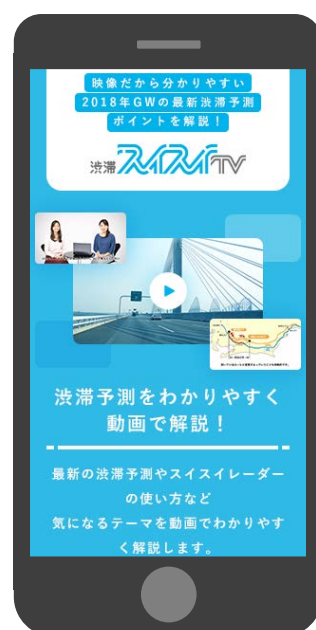
※図はイメージです。