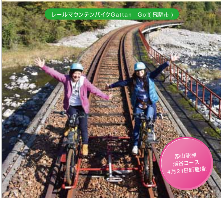
レールマウンテンバイクGattan Go!(飛騨市)