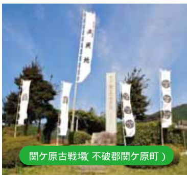
関ヶ原古戦場(不破郡関ヶ原町)