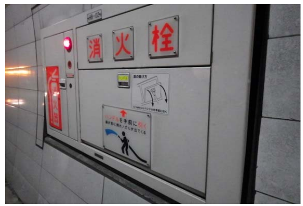
（トンネル非常用設備点検）