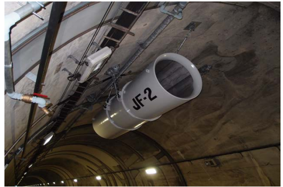
（ジェットファン新設）