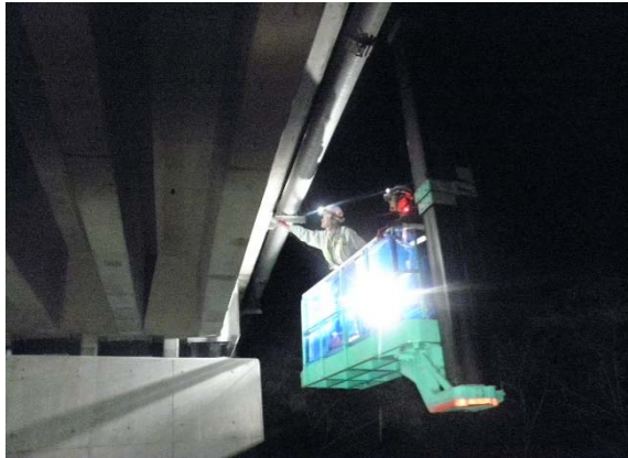
（橋梁点検車を用いた橋梁下面および橋桁の点検）