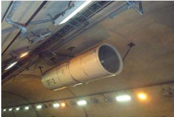
（ジェットファン撤去前）