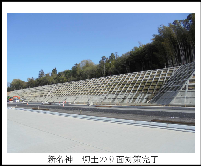
新名神 切土のり面対策完了