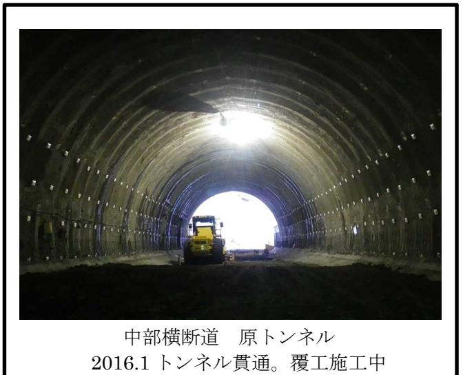
中部横断道 原トンネル 2016.1 トンネル貫通。覆工施工中