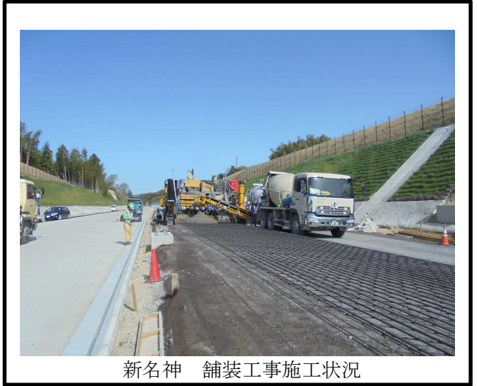
新名神 舗装工事施工状況