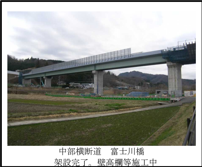
中部横断道 富士川橋 架設完了。壁高欄等施工中