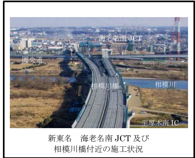
新東名 海老名南 JCT 及び 相模川橋付近の施工状況